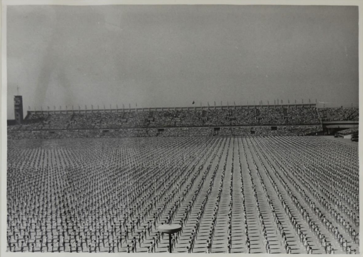
Skladba pro starší káky - čirvea - Strahov