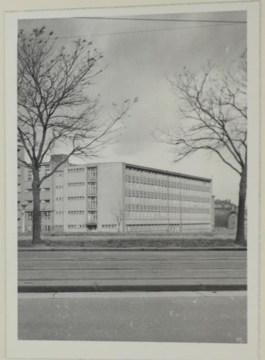
Základní devítiletá škola v Praze 3 Žizkov čp. 2500, Chmelice-sídliska